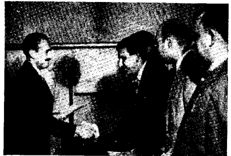
Presenting certificates upon completion of the course.