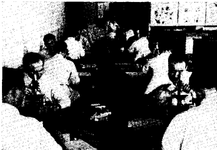
View in the Laboratory. Students at work.